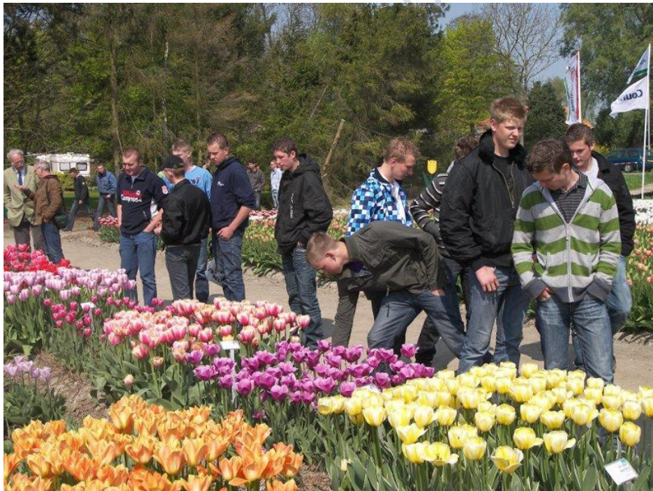
Landelijke leerlingendag Bloembollenacademie