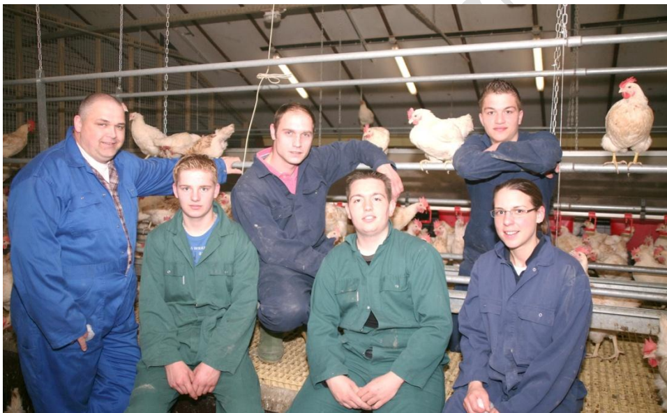
BBL Pluimveehouderij Cursisten 2009

In het schooljaar 2008/2009 is een gedeelte van de BBL opleiding ook gevolgd door 12 BOL deelnemers vanuit Helicon en AOC Oost. In het schooljaar 2009-2010 zijn er zes nieuwe BBL deelnemers ingestroomd. Voor de BOL deelnemers is er door PTC+ een aanvullende 10 daagse opleiding gestart, die ook gevolgd kan worden door medewerkers vanuit het bedrijfsleven. In totaal zijn er 14 deelnemers dit jaar, waarvan 4 vanuit AOC BOL opleidingen en tien vanuit het bedrijfsleven.